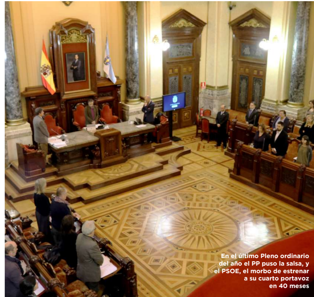
En el último Pleno ordinario del año el PP puso la salsa, y el PSOE, el morbo de estrenar a su cuarto portavoz en 40 meses

Esa y no otra es la única razón para que los socialistas no