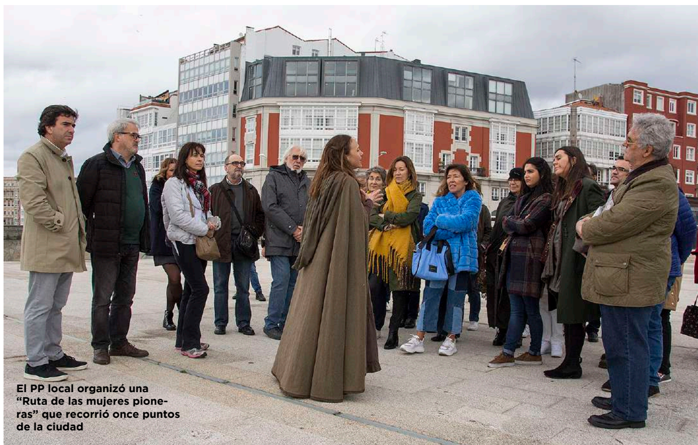
El PP local organizó una "Ruta de las mujeres pioneras" que recorrió once puntos de la ciudad